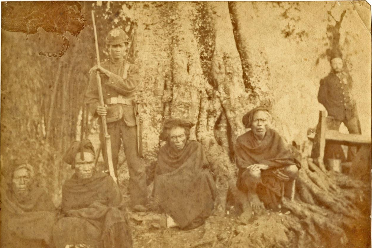
Op de achterzijde van de foto staat geschreven: Ango-molo en Koka'sche hoofden in het bivak Watoe Loko (Zuid Flores). 12 juli 1890

Deze ontmoeting heeft Van Baarda in één van zijn brieven beschreven.